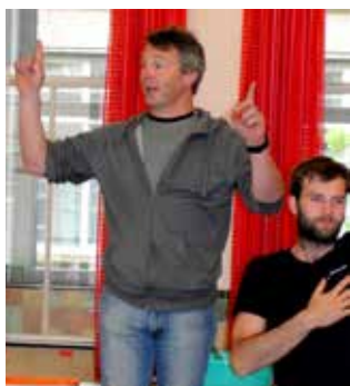
Sportkamp juli 2016