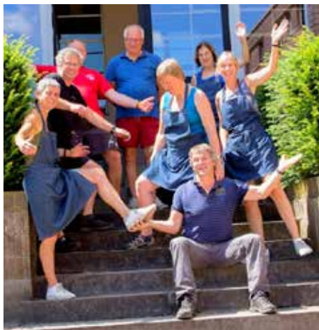
Sportkamp juli 2018