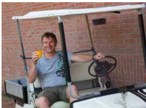
Sportkamp juli 2019