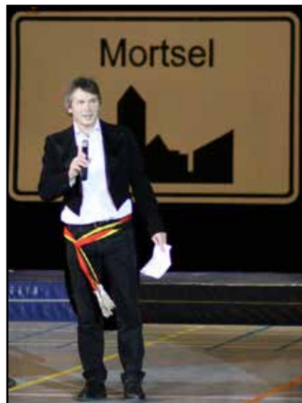
Turnshow maart 2016

Steeds heeft hij een betrouwbare en hardwerkende ploeg gestimuleerd.