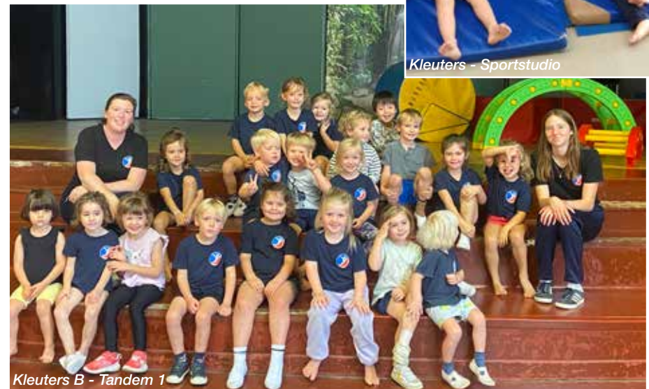
Kleuters B - Tandem 1