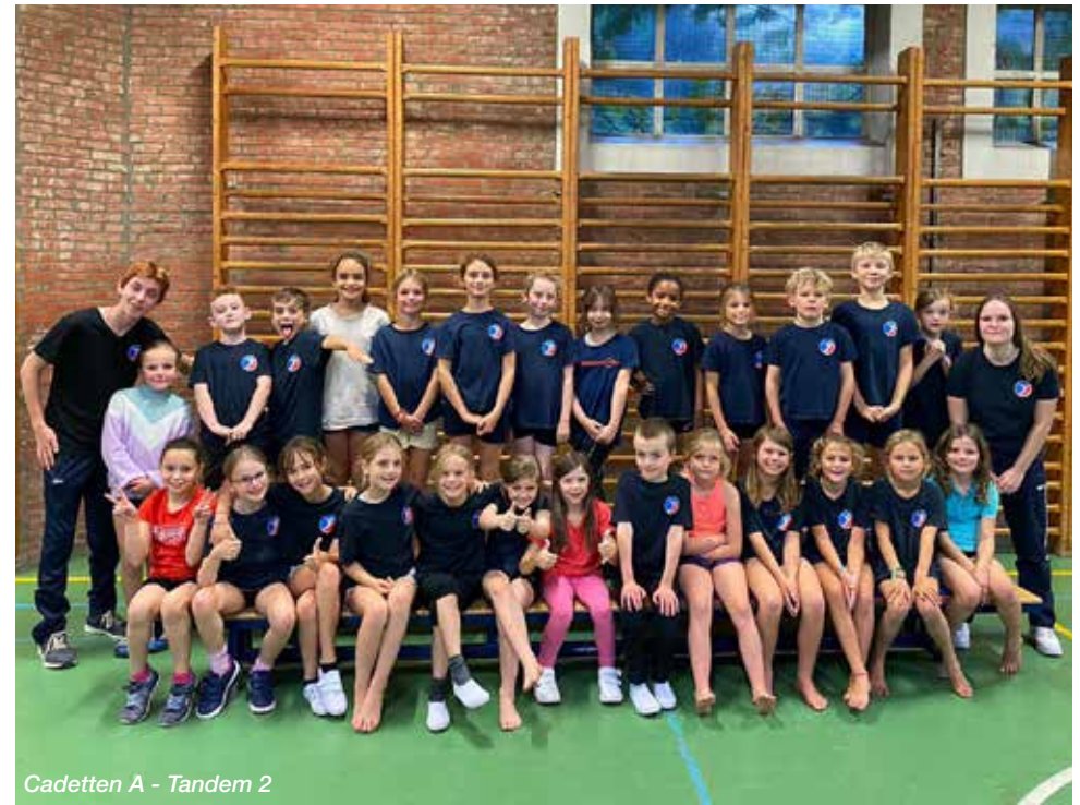
Cadetten A - Tandem 2