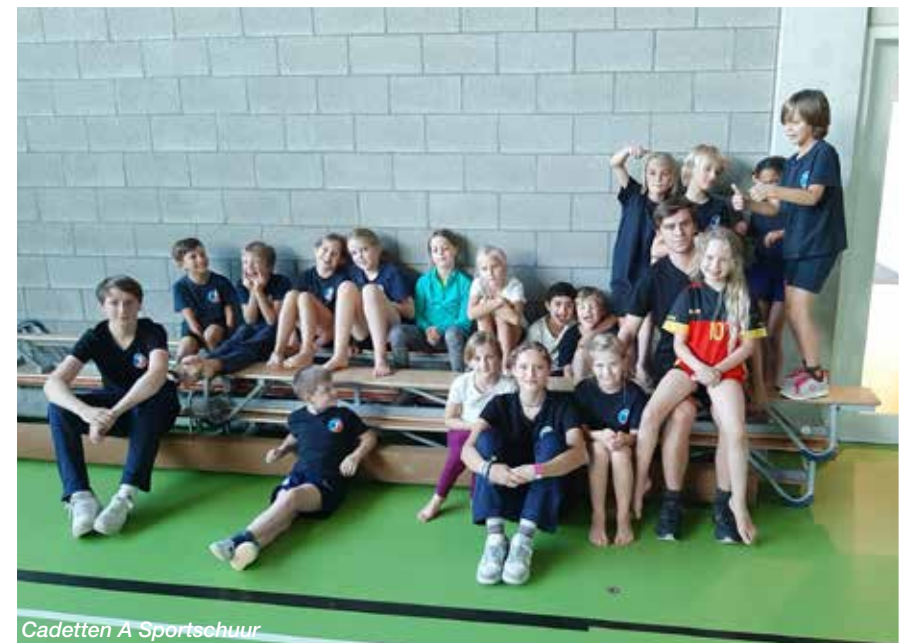
Cadetten A Sportschuur