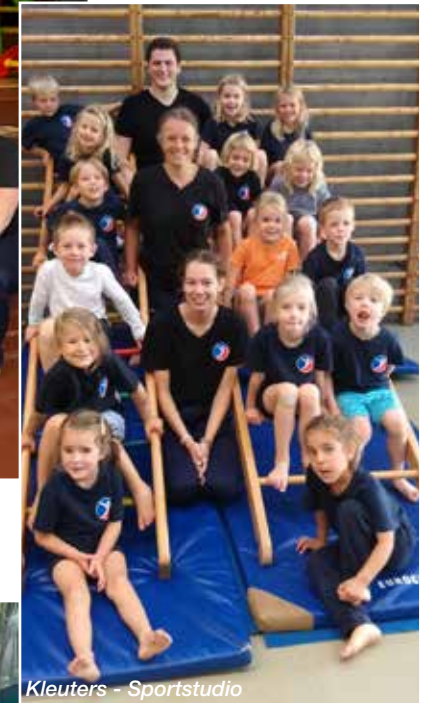
Kleuters - Sportstudio