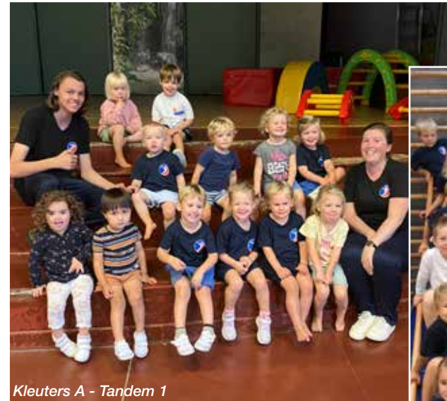
Kleuters A - Tandem 1