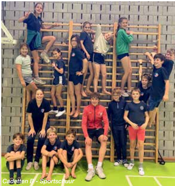
Cadetten B - Sportschuur