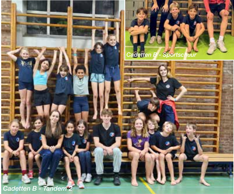
Cadetten B - Tandem 2