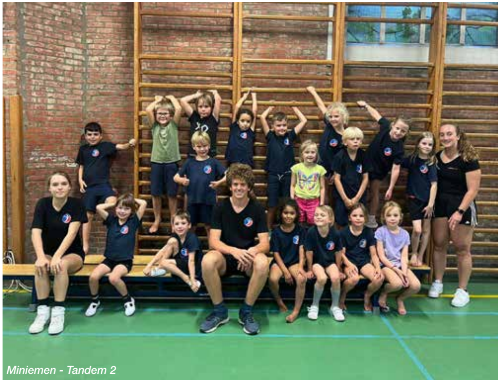
Miniemen - Tandem 2